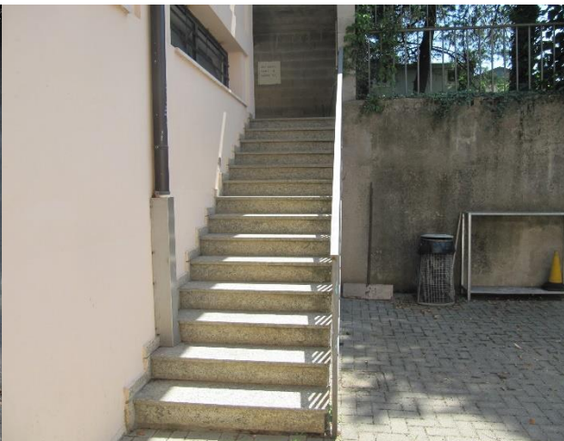
Figura 7. La scala che dagli spogliatoi conduce al campo da gioco a 11.