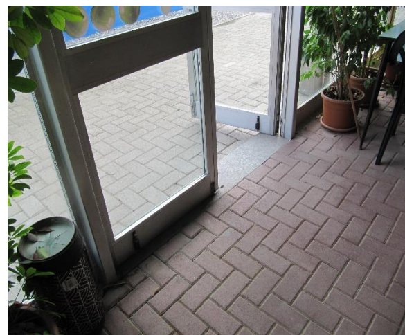
Figura 1. Vista del bocciodromo dall'interno.