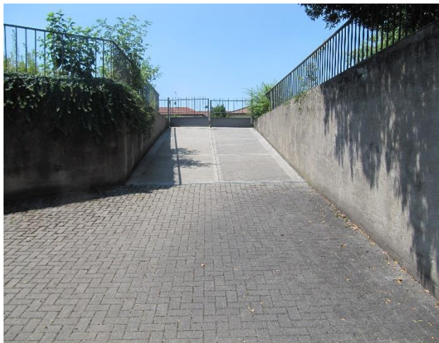
Figura 6. Rampa e cortile oggetto di demolizione. Si prevede di ridurre l'area cortilizia per formare il nuovo accesso al Centro.