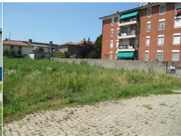
Figura 4. La centrale termica ed i servizi igienici prefabbricati verranno smantellati.