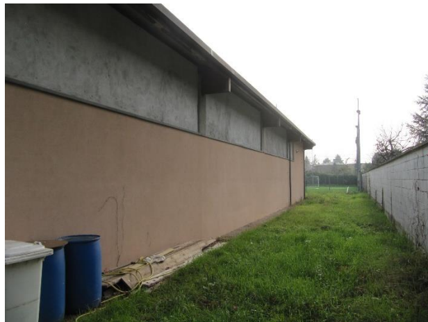
Figura 2. Viste del bocciodromo dal lato N-W