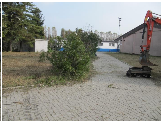
Figura 3. Vista del lato Nord del bocciodromo e dell'attuale percorso che conduce agli spogliatoi, al bocciodromo e, sul lato Sud, ai campi da calcetto.